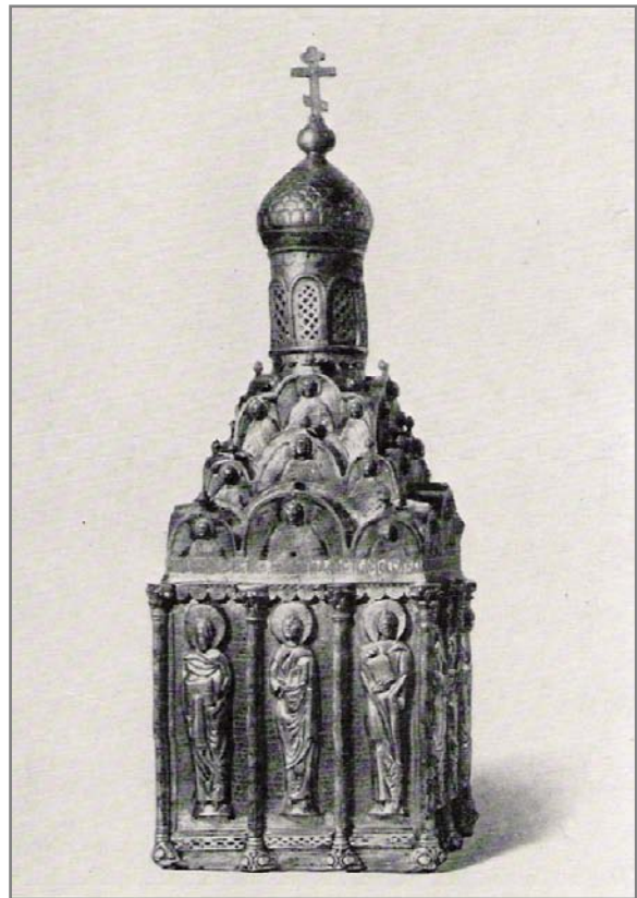
Большой и Малый Сионы Успенского собора Московского Кремля. 1486 год