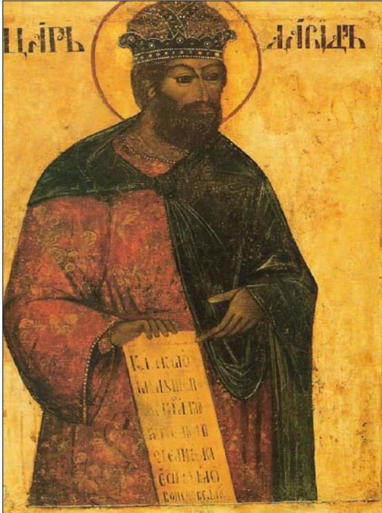
Икона "Святой пророк и царь Израиля Давид"