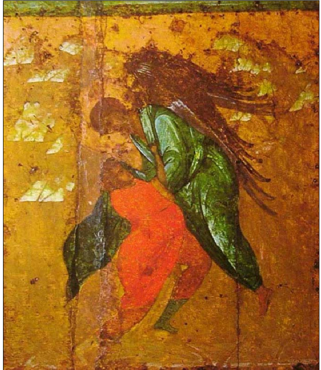
Борьба Иакова с ангелом. Рождение Израиля. Этот фрагмент является клеймом большой иконы "Архангел Михаил с деяниями"