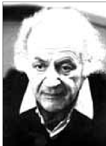
Рольф Либерман, 1982 г.