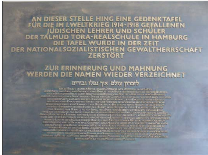
Памятные доски в Талмуд Тора школе