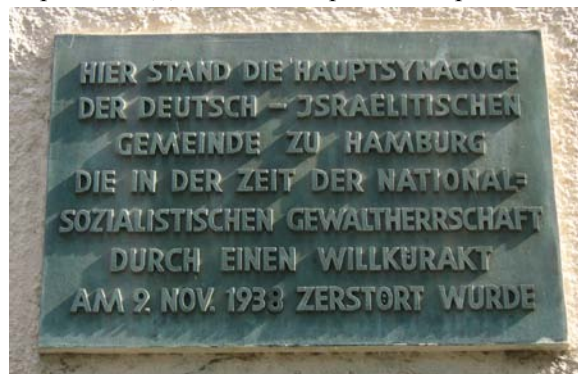
Gedenktafel am Bornplatz Мемориальная доска на Борнплатц

возвращено ортодоксальной еврейской общине и 11-го июня 2007 года, после основательного ремонта, стало новым центром общины, с кошерной кухней и учебными помещениями. С началом нового учебного года (2007/2008) здесь, 65 лет спустя, вновь начались занятия еврейской начальной школы имени Иосифа Карлебаха. До 1942 года раввин Карлебах был