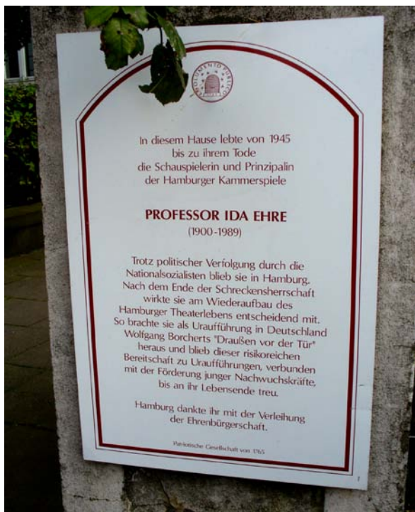
Gedenktafel für die Schauspielerin und Intendantin Ida Ehre

Мемориальная доска на доме, в котором жила Ида Эрэ