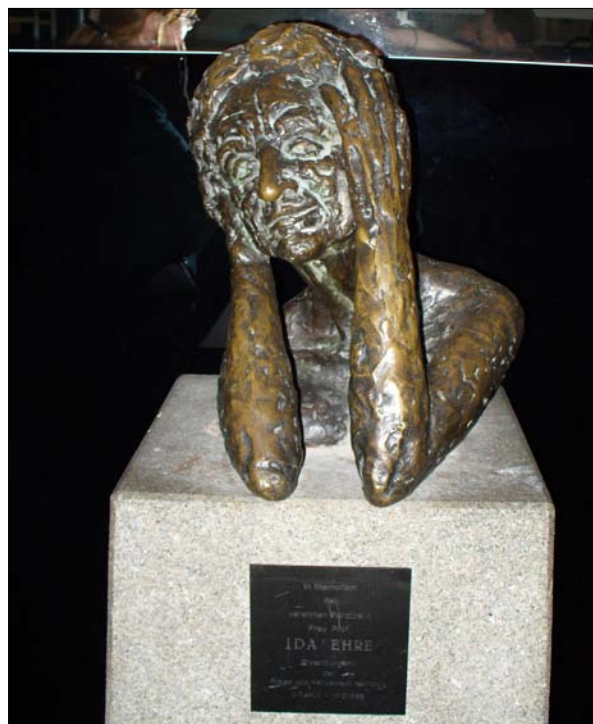
Büste Ida Ehres im Logensaal der Hamburger Kammerspiele

Мы возвращаемся с Гриндельхофа (Grindelhof) назад. На Гриндельхоф 58 в январе 2008 года открылось кафе "Леонар". В нем намерены