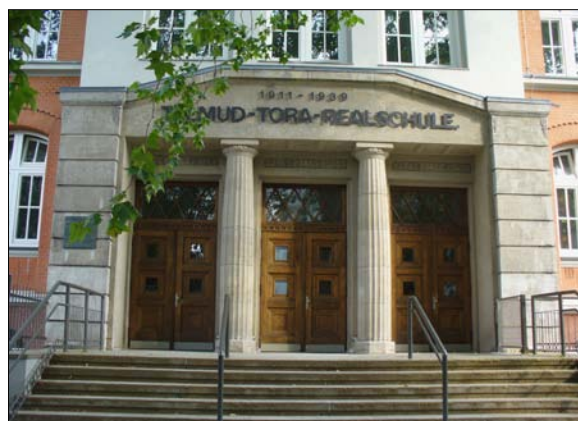
Talmud Tora Schule, heute Gemeindezentrum und Schule