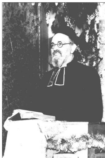
Раввин Иосиф Карлебах