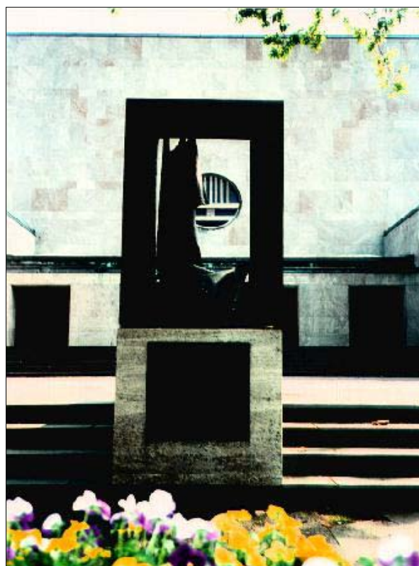
Бывшая синагога общины португальских евреев в Гамбурге, Иннокентиаштрассе 37