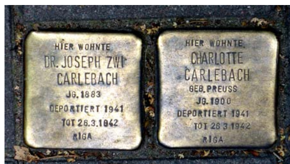
Школа по изучению Торы и Талмуда, сегодня Центр общины и школа