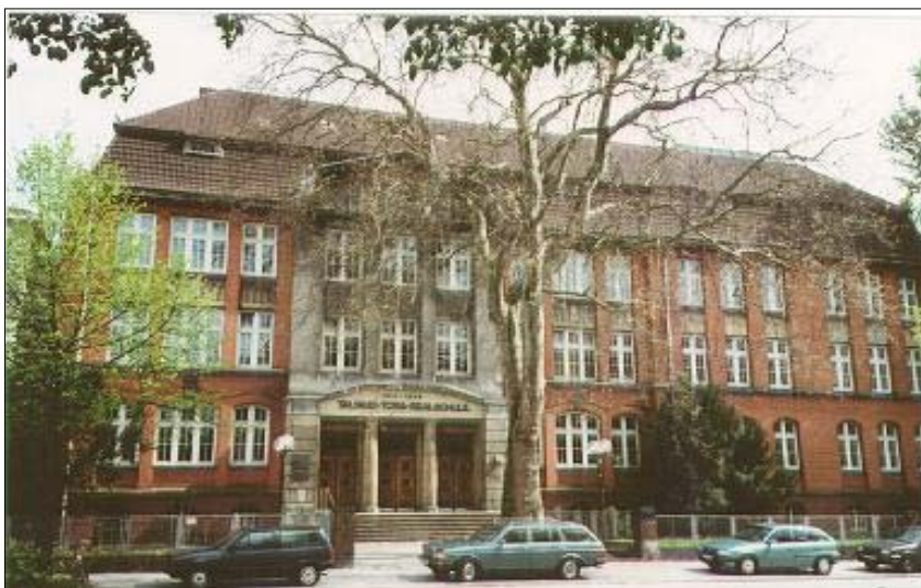
Школа по изучению Торы и Талмуда, сегодня администрация общины и школа