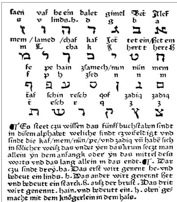
Das erste hebräische Alphabet im deutschen Buchdruck, 1477 Первый еврейский алфавит в немецком книгопечатании, 1477 г.

"Идиш родился из желания европейского еврейства придать особый еврейский смысл самым широким областям жизни вне стен синагоги – исконного обиталища иврита. Идиш призван был заполнить еврейским влиянием те сферы жизни, которые были чужды евреям. Великий порыв, мощное желание, высокий дух породили язык идиш, слова которого складывались в фразы, а из фраз слагались поэзия, песни праведников, басни, изумительные рассказы... И еще один важный момент. Идиш был языком тех, кто был уничтожен в Катастрофе лишь за то, что они были евреями: эти люди говорили на идише, пели на идише, молились на идише до самого последнего вздоха". (Из выступления заместителя Председателя Кнессета Овадия Эли 4 января 1993 года).