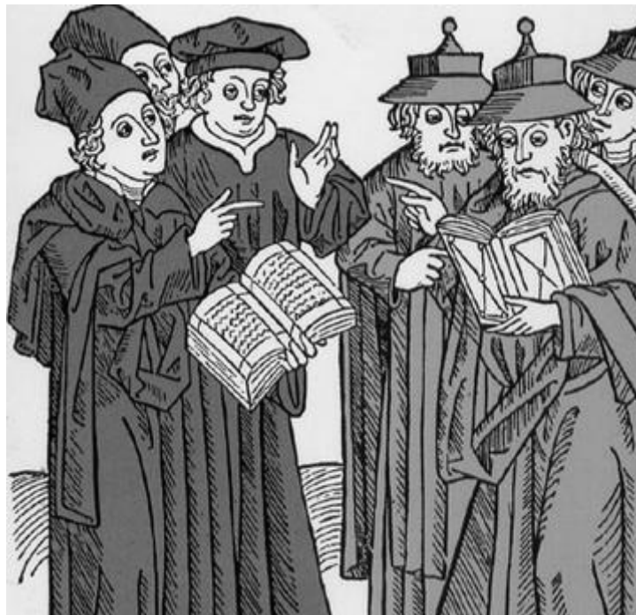
Диспут христианских и еврейских схоластов. Гравюра на дереве, 1483 г.